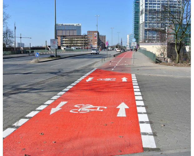
Rot eingefärbter Zweirichtungsradweg

Im Zuge von vorfahrtsberechtigten Geh- und Radwegen im Zweirichtungsverkehr sollen im Bereich von Einmündungen und stark frequentierten Grundstückszufahrten rot eingefärbte Radverkehrsfurten markiert werden. Zur Verdeutlichung, dass Radfahrende aus beiden Richtungen kommen, werden Radpiktogramme mit Doppelpfeil angebracht. Der Kfz-Verkehr wird mit StVO-Zeichen 205 "Vorfahrt gewähren" und dem Zusatzzeichen 1000-32 "Radverkehr kreuzt von links und rechts" beschildert. Um die Aufmerksamkeit noch stärker zu erhöhen und die gefahrenen Geschwindigkeiten des Kfz-Verkehrs zu verringern ist eine Aufpflasterung hilfreich. Die Markierung der Furt gilt auch für den Radverkehr freigegebene Gehwege.